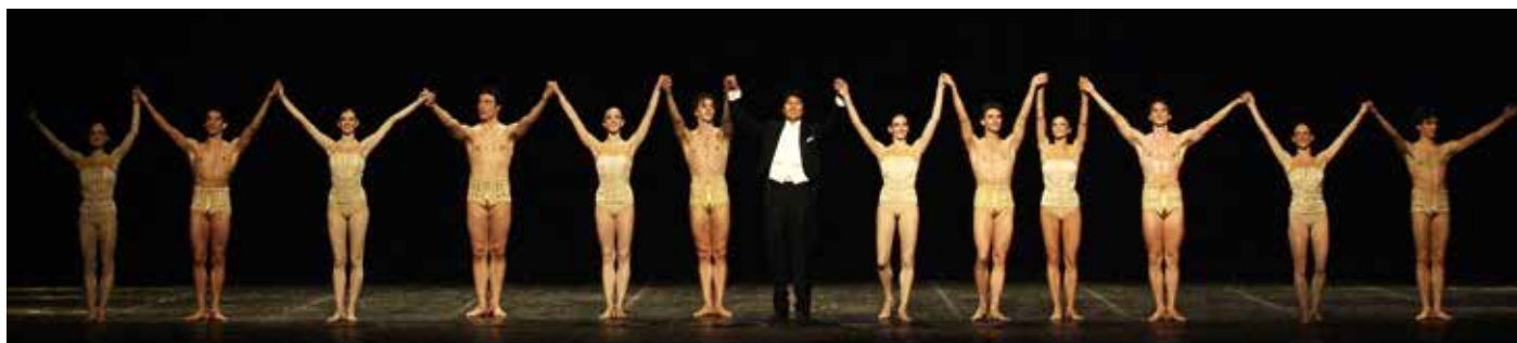
I Saluti di Petite Mort della serata Mozart 2006

Dal 16 al 30 novembre del 2019, Takahiro Yoshikawa tornerà al Teatro alla Scala, dove interpreterà la riproposta dei due tempi lenti dei concerti per pianoforte e orchestra K. 467 e K. 468 di Mozart con l'Orchestra del Teatro alla Scala diretta da Felix Korobov per il Balletto "Petite Mort" di Jiří Kylián.