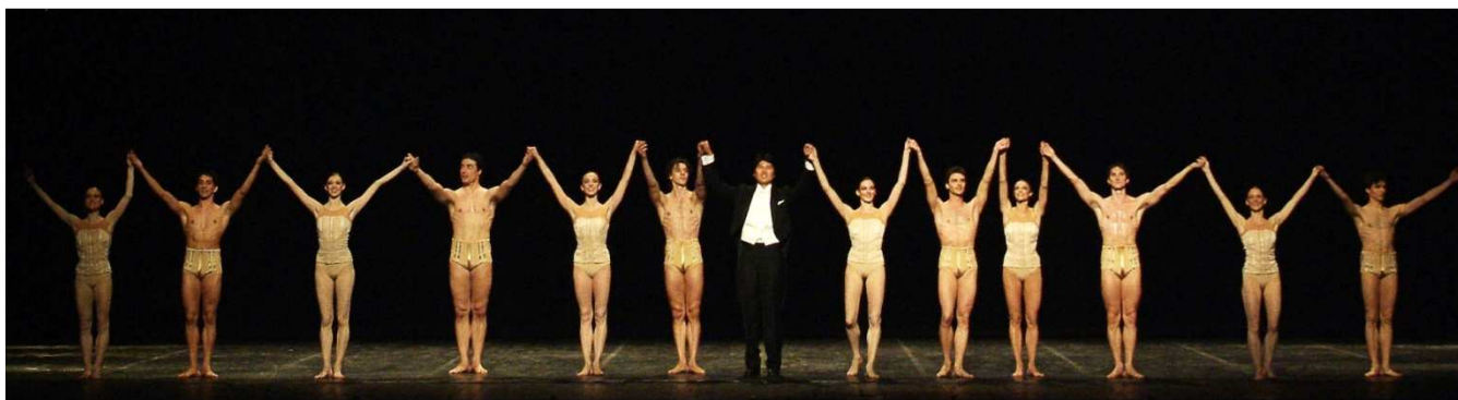
I Saluti di Petite Mort della serata Mozart 2006

Dal 16 al 30 novembre del 2019, Takahiro Yoshikawa tornerà al Teatro alla Scala, dove interpreterà la riproposta dei due tempi lenti dei concerti per pianoforte e orchestra K. 467 e K. 468 di Mozart con l'Orchestra del Teatro alla Scala diretta da Felix Korobov per il Balletto "Petite Mort" di Jiří Kylián.